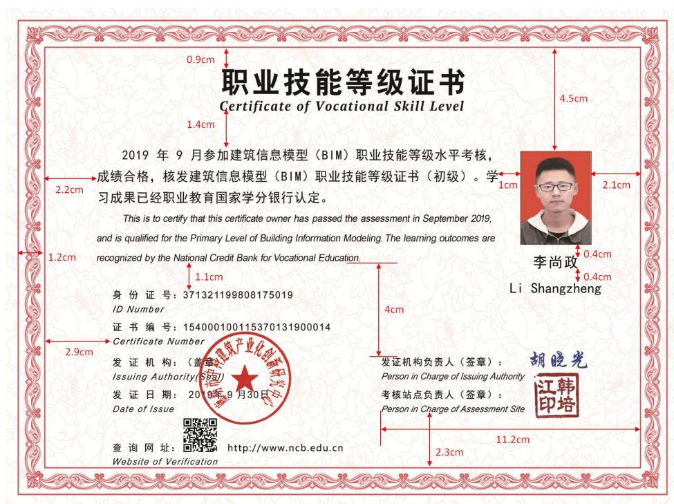
图 1 证书正面